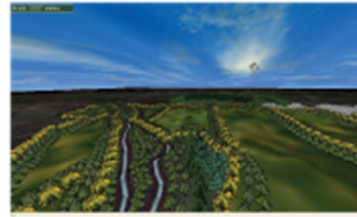
Akarsu kenarı ağaçlandırılmasının 38 gösterimi

1400m yükseltsine kadar Karaçam üzerine Sedir dikildi. Taşlıklarda rüzgârın geldiği yöne göre; Som'lık bir şerit oluşturuldu.