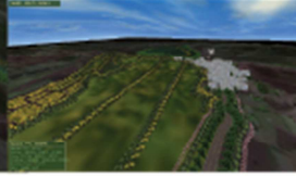
Mera ağaçlandırılmasının 38 gösterimi