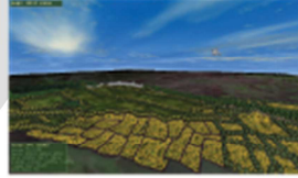
Tarım parsellerinin etrafına tuzluluğun az olduğu yerlere;