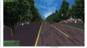
Yol kenarlarının ağaçlandırılması 38 gösterimi